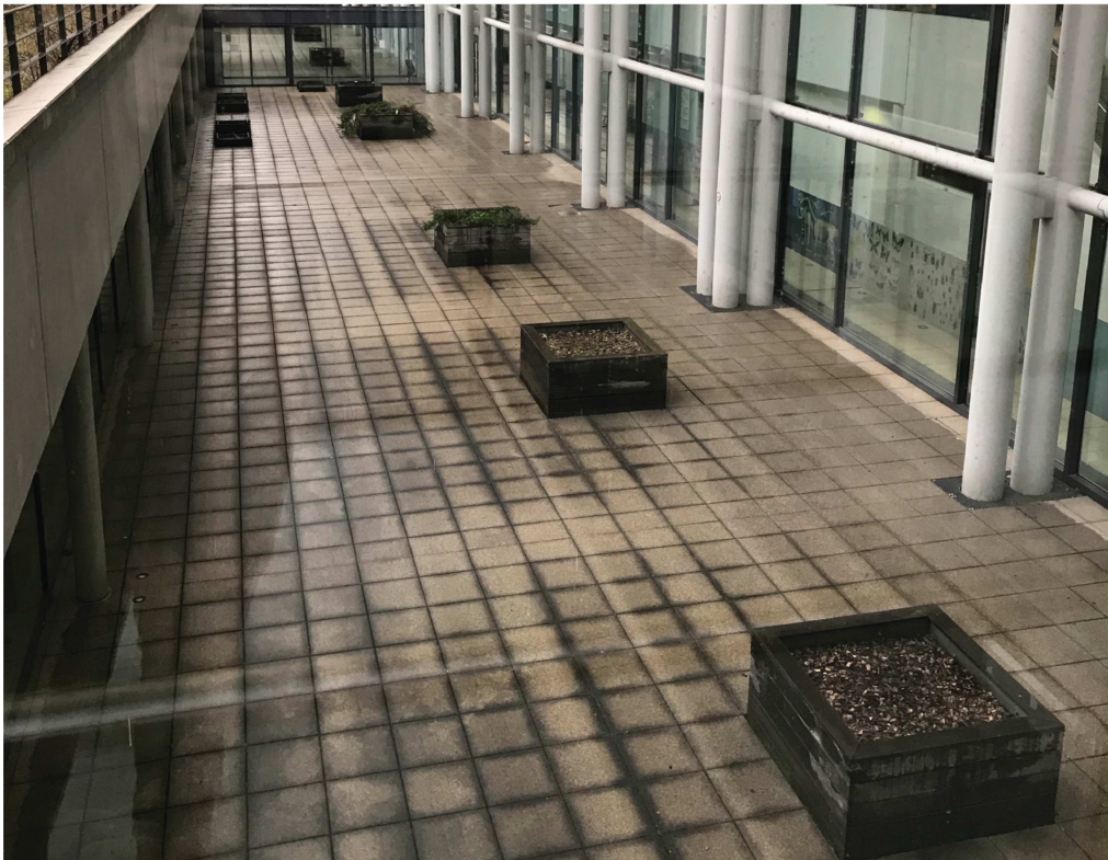
Photo actuelle, disparition des végétaux dans les bacs