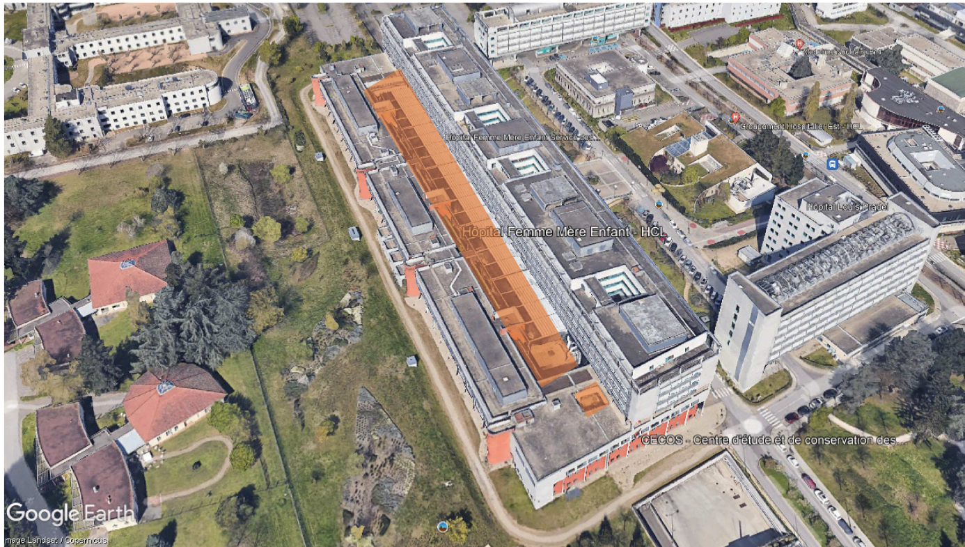
Vue aérienne bât A2 HFME. En orange, la zone concernée, la vallée de l’HFME.