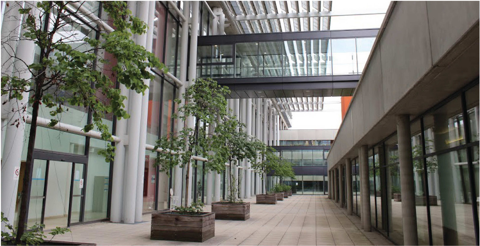
Ancienne photo, avec végétaux existants